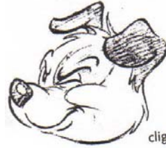
clignant de l'œil